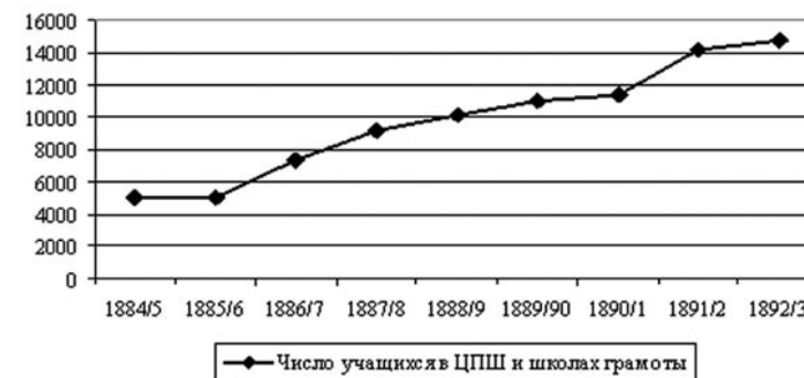
Рис. 3. Рост количества учащихся церковных школ в Калужской губернии.

Количество школ возрастало, росло и число учащихся в них.