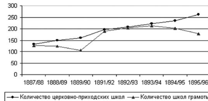
Рис. 4. Динамика развития ЦПШ и школ грамоты в Калужской губернии.

Развитие церковного образования в Калужской губернии представлено в Приложении 28.